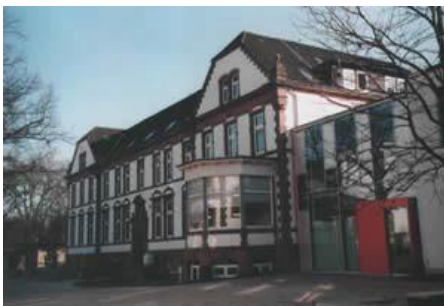
Unser PP-Ausbildungszentrum in Hamburg