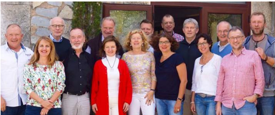
Die Leitungen unserer regionalen Ausbildungszentren

Hierin nicht enthalten sind Kosten für die Einzelsupervision (5.000,- Euro für die erforderlichen 50 Stunden), der Aufwand für die eventuelle Unterkunft am Ausbildungsort und ggf. der Aufenthalt in Tagungshäusern.