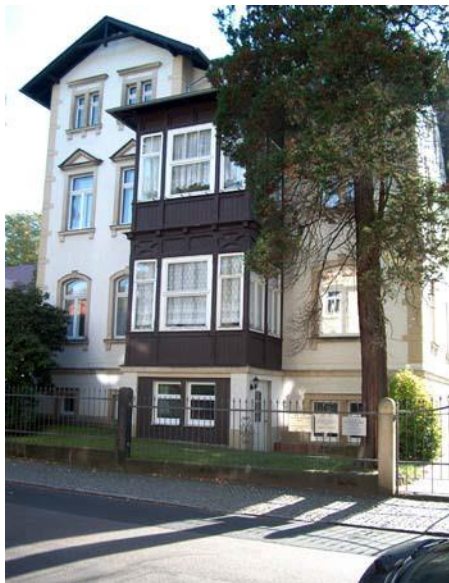
Unser Ausbildungszentrum in Dresden

Gegenstand der schriftlichen Prüfung sind die „Grundkenntnisse in den wissenschaftlich anerkannten psychotherapeutischen Verfahren“ (§ 16 Abs.1 PsychTh-APrV), die im Rahmen einer beaufsichtigten, zweistündigen Klausur geprüft werden. Den staatlichen Gegenstandskatalog hierzu finden Sie unter www.impp.de .